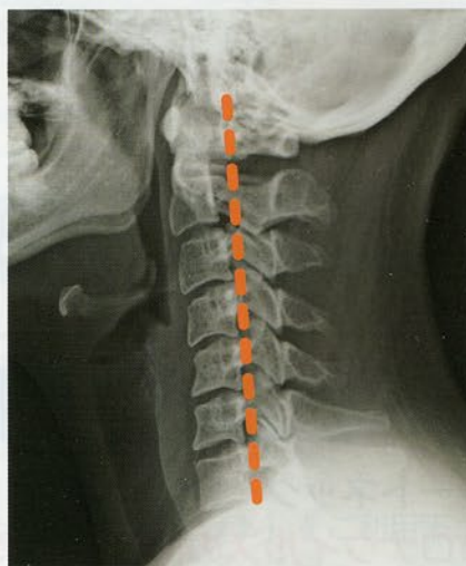
ストレートネック

当院でも、首の痛み、肩こり、背部の張り、頭痛、めまい、ふらつき、上肢のしびれ感、疲れ目、視力低下、ドライアイなど様々な症状を訴え受診される方が増えてきています。その原因にストレートネックが関係していることがあります。