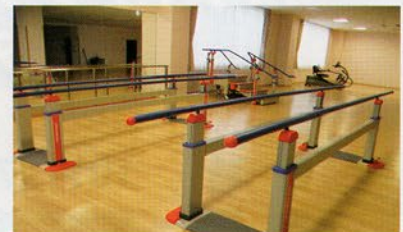
< 入所リハビリ室 >