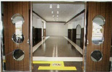
< 玄関 >