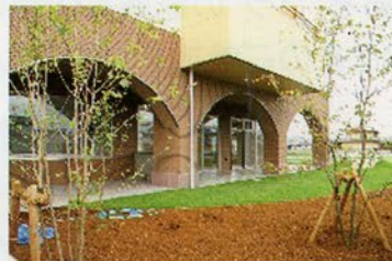
< デイケア外観 >