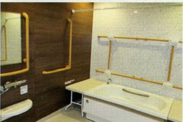
< 個室浴槽 >