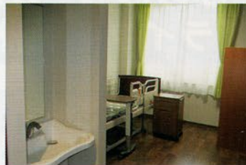
< 居室 >