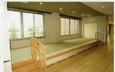
< デイケア休憩スペース >

ご利用者、ご家族の方々が安心して利用できる施設であることを目標に、サービスの質が向上するよう職員一同、精進してまいります。これからもどうぞよろしくお願い申し上げます。