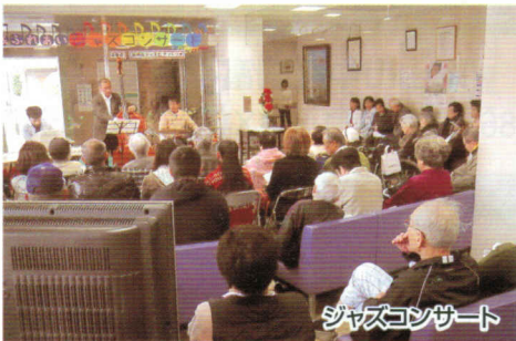
ジャズコンサート